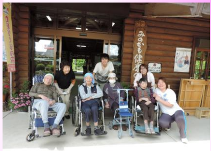
5月：外出支援 (みのかも健康の森へ)