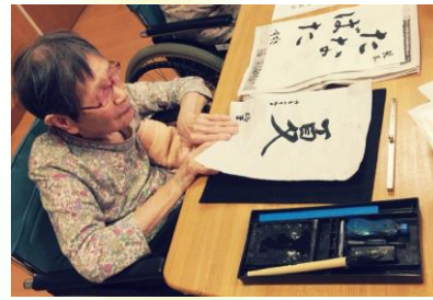
6月：書道レク (上手に書けました！)