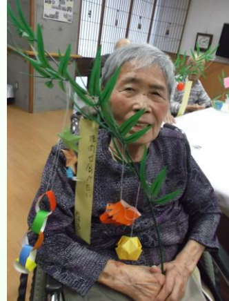
7月：七夕祭り (みんなの願いが叶いますように...)