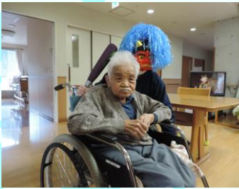
2月：節分 (鬼は外！福は内！)