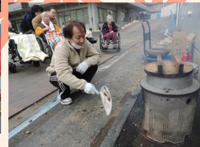
11月：釜炊飯 (やっぱりお釜で炊いたご飯が一番)