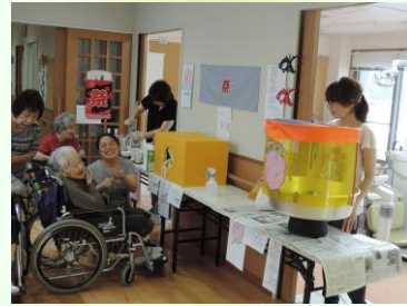
8月：縁日 (ひよこは売ってませんでした。)