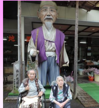
5月：外出支援 (こぶしの里へ)