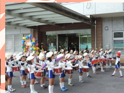
11月：園児訪問 (元気をいっぱい分けてもらいました)