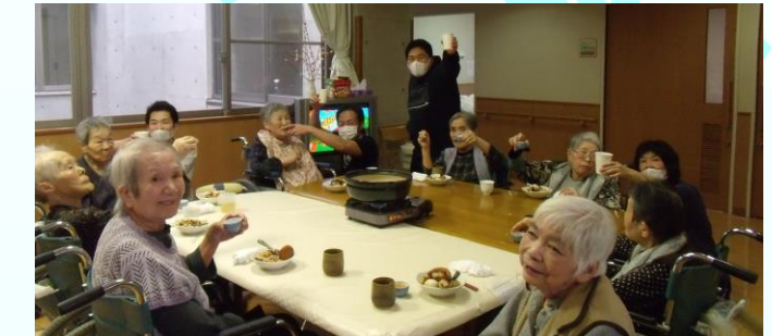
12月：鍋を囲んでおでん！ (今年も1年お疲れ様でした☆)