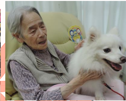
9月：アニマルセラピー (かわいい動物に癒されました)