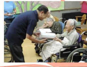
9月：敬老会 (元気に長生きして下さい♪)