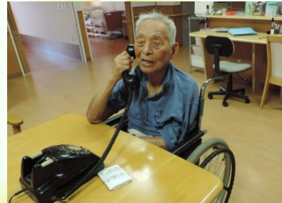
6月：回想法 (みんなで楽しくおしゃべり！)