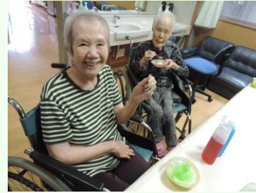
8月：カキ氷パーティー (キーンと冷えます)