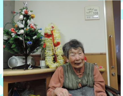
12月：クリスマス会 (ケーキとプレゼント、皆さんの所にもサンタさんは来ましたか?)