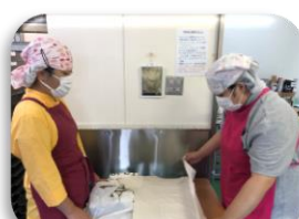
服のたたみ方練習