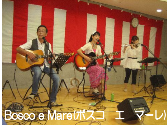
Bosco e Mare(ボスコ エ マーレ)